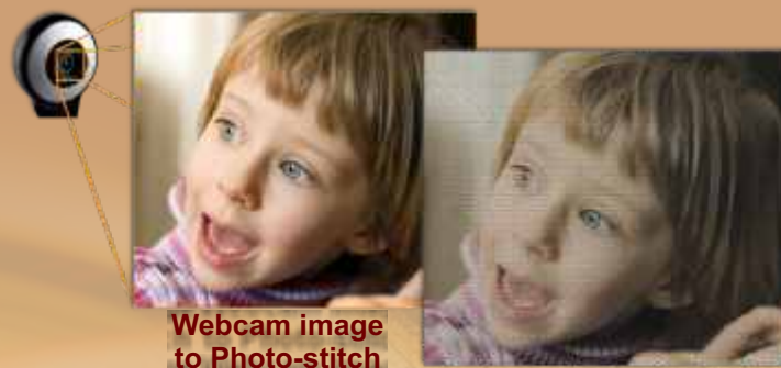
Webcam image to Photo-stitch

Użyj webcam w twoim PC do pobrania obrazu i przetworzenia go w Cross-stitch, Photo-stitch lub w standardowy haft albo użyj obraz jako podkład w projektowanym wzorze haftu.