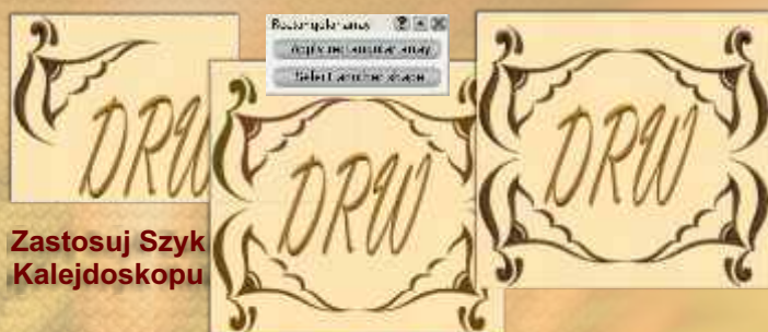
Zastosuj Szyk Kalejdoskopu

Z zaawansowanym narzędziem Szyk Prostokątny wyborem masz możliwość obrócić obiekt i odbić lustrzaną kopię bez gubienia możliwości edytowania ich i utworzyć łatwo unikalne projekty. Masz też możliwość utworzyć klony, które skopiują jakąś transformację, którą robisz w projektowaniu źródłowym.